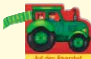
Auf dem Bauernhof Best.-Nr.: 3104