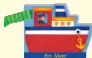
Am Meer Best.-Nr.: 3105