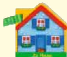
Zu Hause Best.-Nr.: 3106