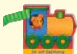
So viel Spielzeug Best.-Nr.: 2922

Die farbliche Kennzeichnung auf den Produkten hilft Ihnen bei der Auswahl des richtigen Spielzeugs und des geeigneten Buches für Ihr Kind.